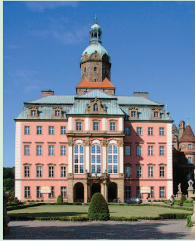
Zamek Książ, 58-306 Wałbrzych, ul. Piastów Śląskich 1